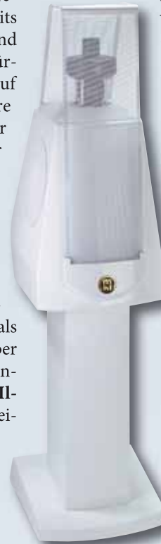
Die große Kompaktbox 120 mit dem MBL-typischen Radialstrahler für Mitten und Höhen

Solche, aber auch subtilere Überraschungsmomente hält die Corona Line jederzeit parat. Sie ist nicht nur ein Blickfang, sondern eine MBL-Anlage von echtem Schrot und Korn. Die Session ist vorbei. Uns hat sie Spaß gemacht.