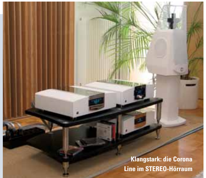
Klangstark: die Corona Line im STEREO-Hörerraum

lauscht man dem abklingenden Hall im Kloster, wo diese Aufnahme stattfand. Alles wird wichtig, jede kleine Regung der Musiker. Dann macht's auf einmal derbe „Bumm“ – die Pauke schlägt zu – und man fährt jäh zusammen.