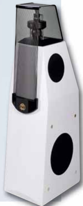
Auch für Corona gemacht: Standbox MBL 116F für 22 000 Euro/P.