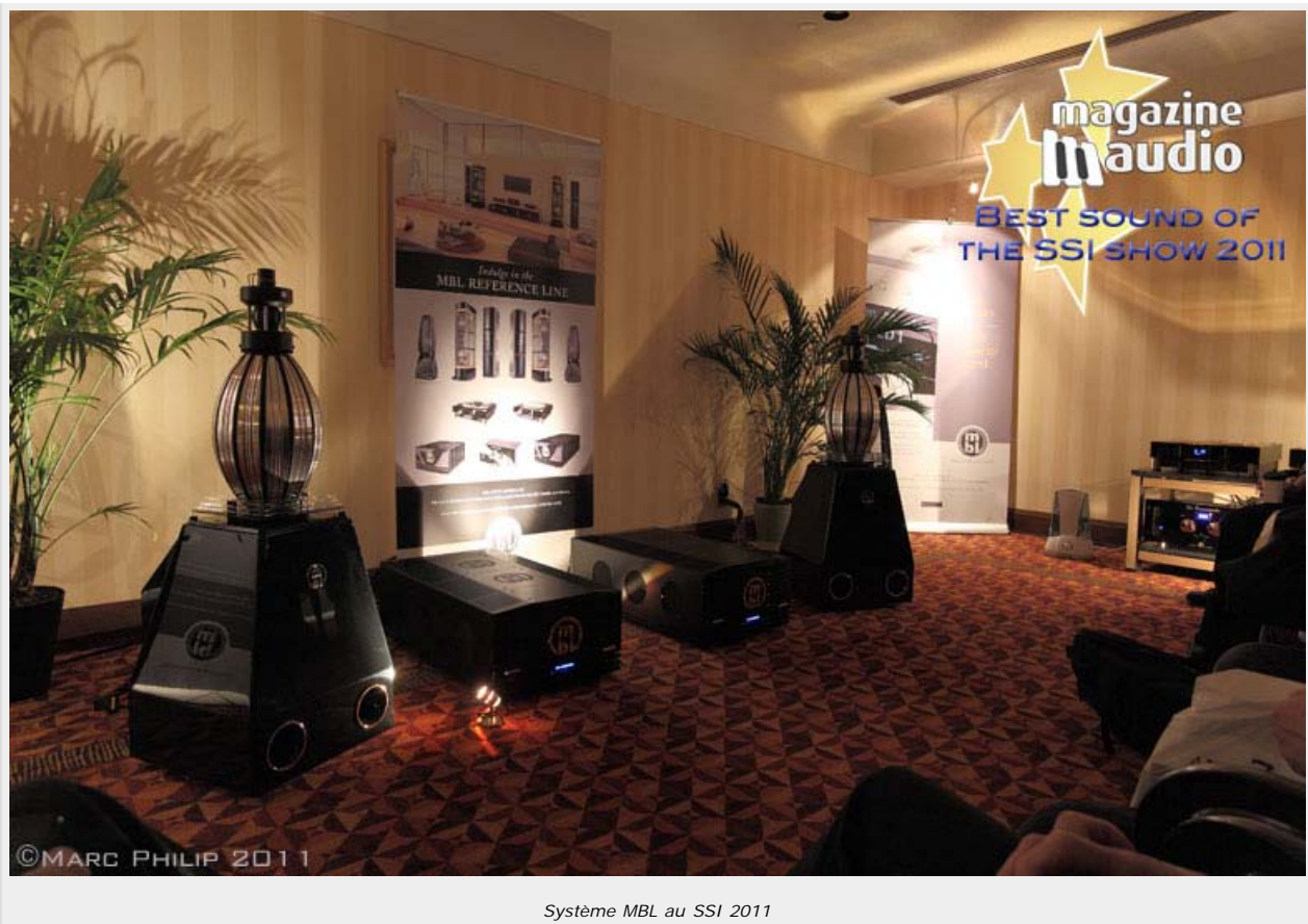
Système MBL au SSI 2011

Une sonorité vivante, une puissance contrôlée, la dynamique est étonnante et pas une once d'agressivité à l'horizon, c'est l'un des meilleures démonstration du show, je me trouvais sur l'axe gauche du système, debout et pourtant, ce que j'ai entendu m'a beaucoup plu.